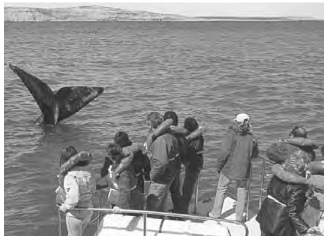
La Ballena Franca Austral se visualiza entre los meses de junio a diciembre. Procrea y da a luz a los ballenatos concebidos en la temporada anterior.

La provincia del Chubut, en el lustro de 1964 al 70, salió a protegerlas como atractivo turístico, consiguió que la fundación Sociedad Zoológica de Nueva York le financiara el estudio de la especie. Esto origino el Programa que encomendaron a Royer Payne, que concretó de 1970 al 2000 la investigación mas completa en la historia de la especie, y un manejo racional turístico administrado en forma coparticipada (Público-Privada), por la Secretaría Provincial de Turismo y Áreas Protegidas. El servicio ha logrado un alto nivel de seis empresas Profesionales Pymes de la especialidad, que lleva a cabo las concesiones de avistajes . En el sector oeste del Golfo en playas de las canteras el municipio local, tienen instalado un sistema de conservación que con su equipo de guardaparques, asisten a los miles de visitantes.