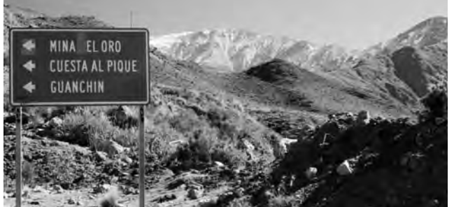
Vuelta al Pique, ascensos y descensos en caracol hasta los 2200 metros y paisajes de nogales