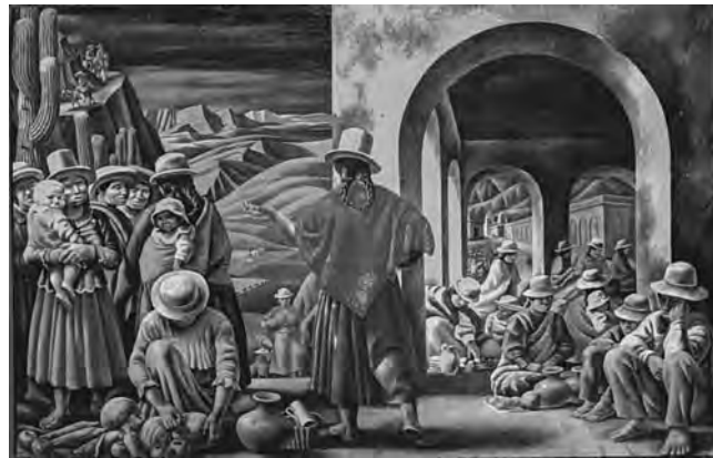
Jujuy (1937) de Antonio Berni, óleo sobre arpillera

Continúa en exhibición la muestra La hora americana en el Museo Nacional de Bellas Artes, Avenida Figueroa Alcorta 1473, Buenos Aires. Presenta los temas andinos en el arte argentino, entre los años 1910 y 1950, representada por el americanismo, corriente estética e ideológica del nacionalismo cultural.