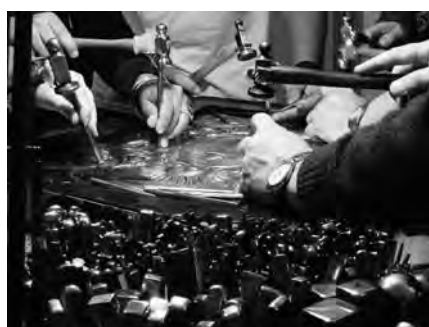
Cincelado del Escudo Nacional

Las mismas serán los sábados de 18 a 19.30. El 21 de junio: Arte y técnica de la orfebrería religiosa , parte II y el 28, El oficio de la Orfebrería Civil . Ambos con entrada gratuita.