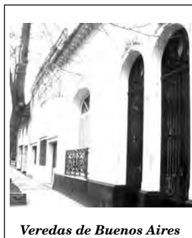
Veredas de Buenos Aires

Buenos Aires, República Argentina - Miércoles 18 de junio de 2014 - N° 1416 - Año XXIX