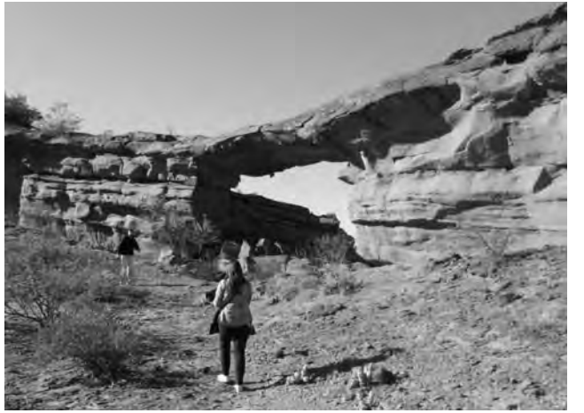
Puente Natural en el circuito de trekking Los Colorados