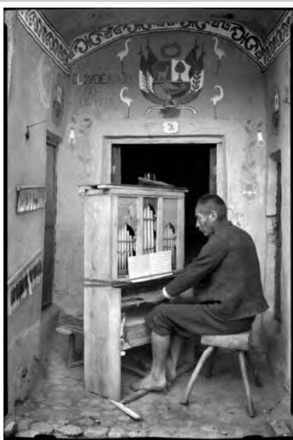
Organista de Tinta de Martín Chambi

etnógrafo autodidacta y dedicó gran parte de su vida a estudiar la diáspora africana, el comercio de esclavos, las religiones afro-brasileras y el flujo económico y cultural desde y hacia África. Leo Matiz nació en 1917 en Rincón Guapo, una aldea de Aracataca, Magdalena, Colombia. Sus retratos reflejan gran interés por la música popular y académica y sus dotes de fotoreportero y artista visual lo acercaron a tomas de grandes artistas plásticos, escritores y políticos coetáneos, Horario: martes a viernes de 14 a 19, sábados, domingos y feriados de 11 a 19. Lunes cerrado. Entrada general: $5. Miércoles y jueves gratis. La muestra permanecerá abierta hasta el domingo 27 de julio. Informes: ☎ (011) 4327-0228 mifb_comunicacion@buenosaires.gov.ar