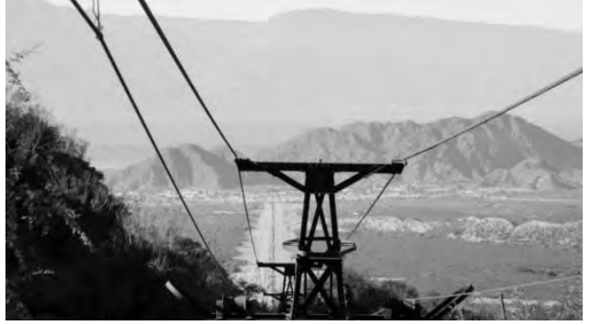
Cable carril Chilecito - La Mejicana, una gran obra de ingeniería, monumento del pasado minero