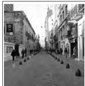
Callecitas del Centro Porteño

Buenos Aires, República Argentina - Miércoles 25 de junio de 2014 - N° 1417 - Año XXIX