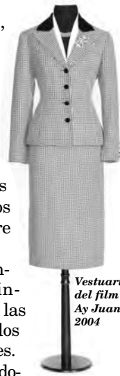
Vestuario del film Ay Juancito 2004

Visitas guiadas: Planta principal: sábados y domingos 14.30 y martes a domingos a las 17.30. Horario del museo: martes a domingos 14 a 19. Entrada $ 20. Jubilados con carnet y menores de 12 años gratis - Martes entrada libre. Informes: ☎ (011) 4801-8248 www.mnad.org