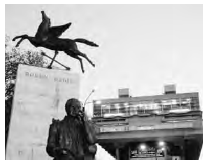
El edificio de la Biblioteca Nacional junto al Monumento a Rubén Darío