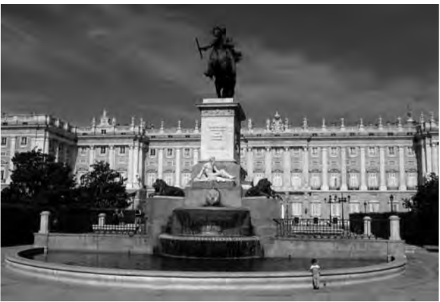
Palacio Real en Madrid, España

Madrid, España - PhotoEspaña 14. Con la presencia de más de cien exposiciones y con el lema Nos vemos . Completa su programación con muestras en las ciudades de Alcalá de Henares, Alcobendas, Getafe, Cuenca y Zaragoza. Además, Festival off, en el que participan algunas de las mejores galerías de arte de la ciudad (hasta el 27/7) Informes: http://www.phe.es