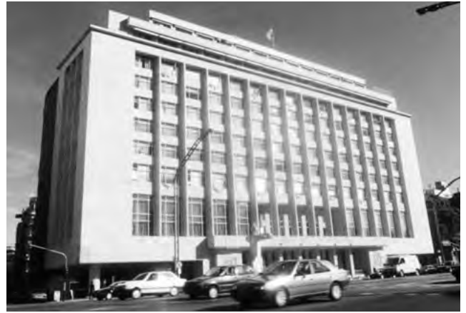
Sede Central del Automóvil Club Argentino en la Avenida del Libertador

La Ley 12.315: publicada el 27 de octubre de 1936 autoriza al Poder Ejecutivo a reconocer los docu-