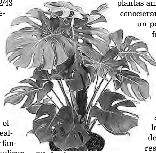
Filodendro, un amor

Recuerdo que allá por los años 1942/43 entré en conocimiento, por intermedio de un profesor de botánica que me apreciaba mucho como a un alumno muy aplicado, del resultado obtenido de un experimento que realizaron en los Estados Unidos varios profesores colegas suyos. El fin era comprobar si las plantas, los vegetales a los que miramos y no comprendemos, tienen vivencias propias, similares a las de otros seres vivos que pueblan el Planeta. Mi profesor dijo que era realmente extraordinario, por no decir fantástico, el resultado obtenido al realizar pruebas de sensibilidad en los vegetales.