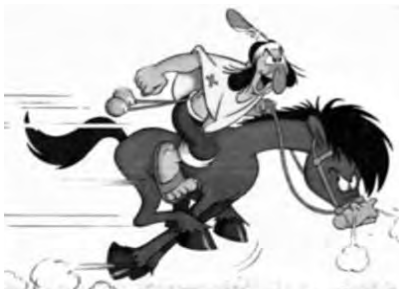
Imagen del entrañable Patoruzú y su Pampero

Alvaro Sires en su libro Pampero relata que los descubridores, sufrieron las consecuencias y el maltrato de este viento que todavía no tenía nombre. Muchas fragatas como Nuestra Señora de Loreto, Nuestra Señora de la Asunción y el San Ignacio de Loyola naufragaron a causa de estos violentos temporales en el infierno de los pilotos como así se conocía al Río de la Plata. En mayo de 1806, previo a la invasión, un furioso Pampero echó a pique a tres de las cañoneras británicas, dejando desmanteladas las dos restantes. Más de una vez, el furioso viento dejó en seco el Río de la Plata, quedando al descubierto su lecho hasta más allá del horizonte.