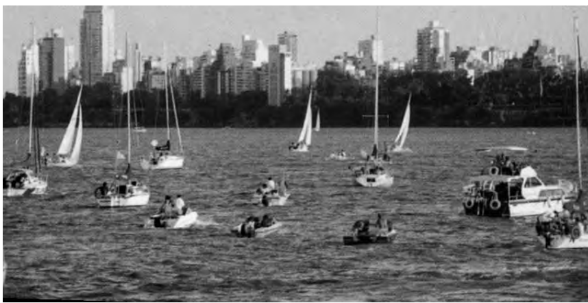
La ciudad de Rosario ofrece atractivos naturales, históricos y culturales para disfrutar de escapadas de fin de semana

El objetivo, es desarrollar capacidades y habilidades orientadas a la generación y o perfeccionamiento de emprendimientos que pro-