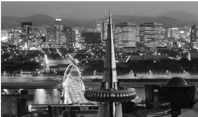
La impactante ciudad de Daejeon en Corea del Sur

VIENE DE TAPA. Con motivo del próximo viaje del Papa Francisco a Corea del Sur, en el Centro Cultural Coreano, Av. Coronel Díaz 2884, Buenos Aires el viernes 18 de julio , a las 19, se inaugurará la muestra El Papa Francisco y la comunidad coreana a través de imágenes .