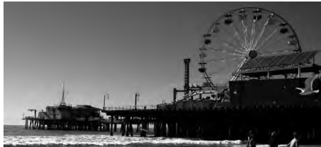
Santa Mónica en Los Ángeles, EE.UU.

Los Ángeles, Estados Unidos - Convention - Global Business Travel Association. Punto de encuentro para los representantes del sector de los viajes de negocios, con workshops, conferencias y talleres. (hasta el 30/7) Informes: www.gbta.org