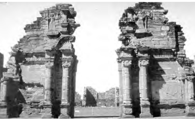
Ruinas de San Ignacio Mini en Misiones

Las Misiones Jesuíticas Guaraníes, Misiones -Declaradas Patrimonio Cultural de la Humanidad en 1984-