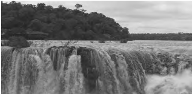
Garganta del Diablo en el Parque Nacional Iguazú, Misiones

Cataratas del Iguazú, Misiones -Declaradas Patrimonio Natural en 1984 y una de las 7 maravillas del mundo-