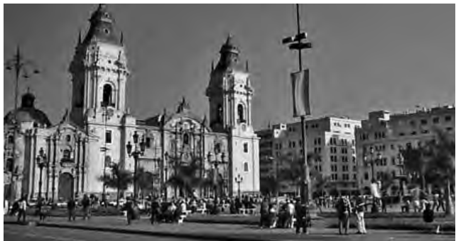
La Catedral de Lima, Perú ha sido ampliada y reconstruida varias veces debido a los terremotos.

Lima, Perú - Mistura 2014. Con el lema Come peruano , se presentará esta Feria gastronómica en la Costa Verde de Magdalena del Mar. Los stands se agruparán temáticamente -Criollo, Brasas y anticuchos, Cevicherías, Andino y Amazónico, Sureño, Norteño, de las Carretillas, de los Sánduches, Chifa y Nikkei, de los Dulces y de los Bares-, mientras que el mundo del Pan se representará con wawas, chaplas y otros de tradición peruana. También se desarrollarán charlas y foros por la Sociedad Peruana de Gastronomía. (hasta el 14/9) Informes: www.mistura.pe