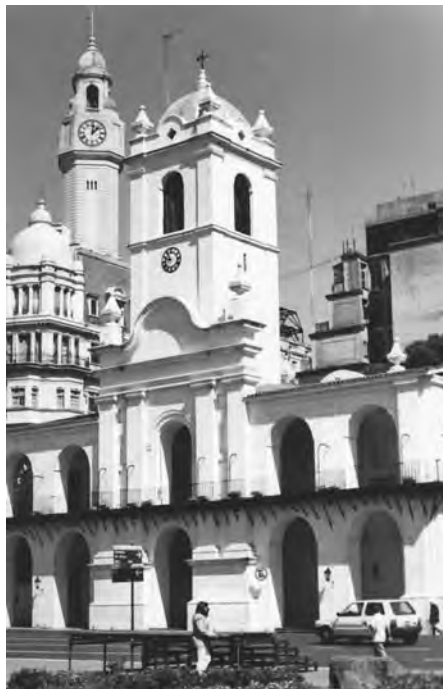
El Cabildo de Buenos Aires símbolo de nuestra historia

Posteriormente se sucedieron las ampliaciones y modificaciones hasta que, en 1714, el gobernador Bruno Mauricio de Zabala resolvió encarar la construcción de un edificio apropiado para las funciones de los cabildantes. Se solicitó la colaboración de expertos que elaboraron distintos proyectos, todos sin éxito. Hasta que, en 1725, se aprobaron los planos presentados por el sacerdote jesuita Andrés Blanqui y se inició la faena. En 1751 se le agregó al diseño original una torre cuadrada terminada en cuatro pináculos y una pequeña cúpula poligonal. Y, por fin, el 1° de enero de 1765 comenzó a funcionar en esa torre un reloj traído de España a instancias del Procurador, don Nicolás de Zinguinaga, que fue comprado con el dinero que rindió la venta de un centenar de cueros enviados a Cádiz y que se ocupó de instalar al técnico Luis Cachemmaille. Coincidentemente con la colocación del artefacto, la torre fue azulejada por Fermín de Aoiz y al año siguiente se le colocó una campana bautizada Nuestra Señora de la Concepción, cuya imagen rodeada de estrellas se advertía en relieve en uno de sus lados, en tanto al otro existía una cruz en bajorrelieve. Cabe recordar que el mencionado reloj no fue el primero con el que contó la ciudad pues en 1714 ya se había instalado uno en