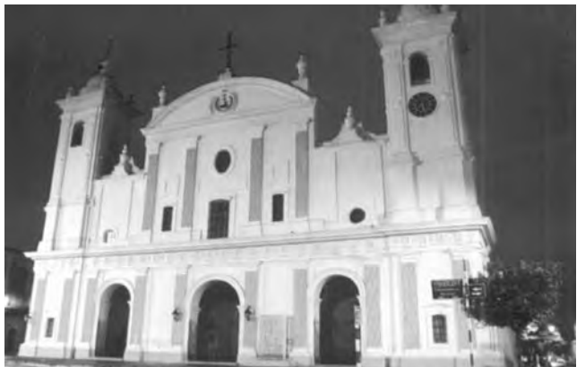
La Iglesia Catedral de Asunción, fue la primer diócesis del Río de la Plata. Don Carlos Antonio López mandó construir la actual Iglesia Catedral que fue inaugurada en 1845. En su frente se encuentra un monumento a Domingo Martínez de Irala, primer gobernador del Río de la Plata.

Asunción, Paraguay - PTM - Paraguay Travel Mart. 3ª edición en conjunto con el 1º Mercosur Travel Mart, encuentro profesional de promoción y comercialización regional. (hasta el sábado 24/8). Informes: www.visitusacr.com