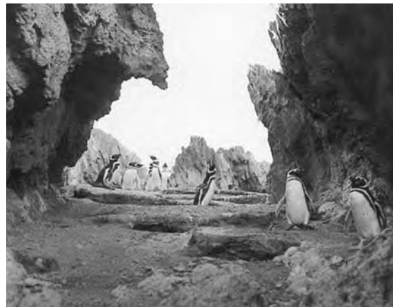
La reserva de Punta Tombo concentra la colonia reproductora de Pingüinos de Magallanes más grande de la costa Patagónica con más de medio millón de ejemplares