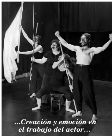
...Creación y emoción en el trabajo del actor...