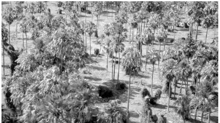
Cuidar los ecosistemas, como el Bañado de La Estrella en Formosa, está cobrando cada vez más valor en la conciencia colectiva

Con el advenimiento de la revolución industrial y posteriormente la revolución científico-tecnológica, la calidad de vida del hombre ha ido en aumento, lo que significa poner al alcance de un número mayor de personas mejores condiciones en aspectos tales como: salud, alimentación, vivienda, vestimenta, educación y es-