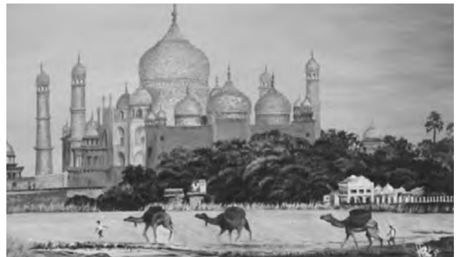
El Taj Mahal, uno de los monumentos más emblemáticos de la India, pintado por Horacio Anibal Rodríguez