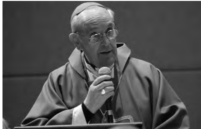
Encuentro Pastoral Urbana de Buenos Aires en la Universidad Católica Argentina. Año 2012