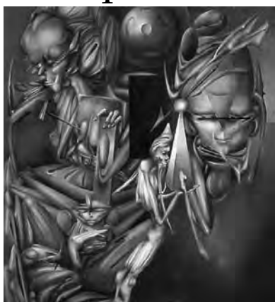
Pensamientos impensables, óleo de Juan Campodónico

Se la podrá visitar con entrada libre de lunes a viernes de 10 a 13, de 15 a 19 y los sábados de 10 a 13, domingos pedir