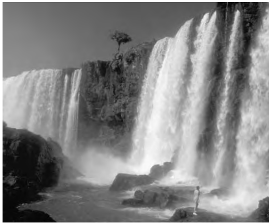
Las bellezas naturales reciben un cuidado especial al ser declaradas Parques Nacionales y atraen al turismo como es el caso de las Cataratas del Iguazú.

por Antonio Torrejón torrejon@turismo.com.ar