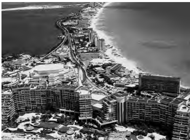
Las extensas y cálidas playas de Cancún, México, atraen a turistas de todo el mundo

Cancún, México - Alta Airline Leaders Forum. Encuentro anual de empresas aerocomerciales. Habrá seminarios, talleres, conferencias, workshop y servicios. (Hasta el jueves 15/11). www.airlineleaders.com