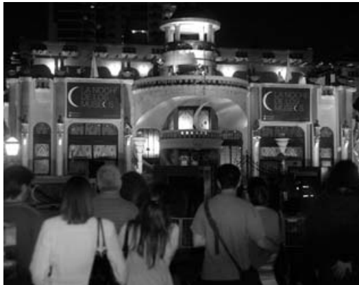
La Dirección General de los Museos que se encuentra en el edificio de la ex Cervecería Munich en la Costanera Sur

Participarán 190 museos y espacios culturales en 27 barrios porteños. Habrá recitales en las calles, muestras, intervenciones estéticas en espacios públicos, espectáculos y talleres infantiles, entre otras actividades.