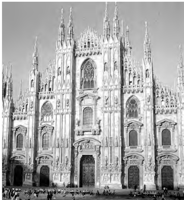
El Duomo de Milán, una obra arquitectónica admirada por turistas de todo el mundo

Milán, Italia - Borsa Internazionale del Turismo. Una oportunidad para los negocios del turismo con alrededor de 2000 profesionales y cursos de capacitación. (Hasta el 17/2/2014) Informes: www.bit.fieramilano.it