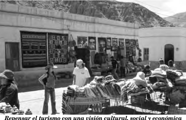
Repensar el turismo con una visión cultural, social y económica de las distintas comunidades, como las de los pueblos originarios del norte de nuestro país, es uno de los objetivos de la recientemente creada Academia Argentina del Turismo