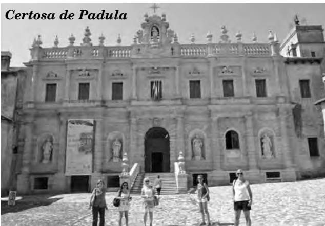
Certosa de Padula

El monasterio, fundado en 1306, contaba con el claustro más grande del mundo -casi 12.000 metros cuadrados- y aparece circundado por 84 columnas. La parte principal es de estilo barroco y ocupa una superficie de 51.500 metros cuadrados sobre los que se han edificado 320 habitaciones.