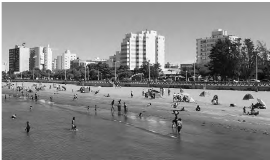
La ciudad de Puerto Madryn, un destino para disfrutar todo el año

Fuimos a un lugar llamado el chorrillo del salto . Luego de una caminata sencilla de unos 4 kilómetros, llegamos a un lugar encantador, un salto de unos 20 metros de alto, en un entorno de piedras y arbustos, con un microclima, que nos permitió despojarnos de los abrigos y hacer un picnic.