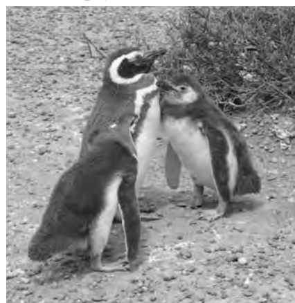
Los Pingüinos de Magallanes buscan las tierras del sur para anidar y tener a sus crías

A unos 200 kilómetros una pequeña ciudad, El Chaltén, a donde encontramos que el 80% de los turistas es extranjero, y van a escalar el Fitz Roy, ese imponente cerro que alguna vez el Perito Moreno confundió con un volcán. Las fotos de este monte pueden mostrar imágenes distintas, ya que cambia de color según la ubicación del sol y gran parte del tiempo sus picos se esconden detrás de una nube blanca. Jugamos a descubrir el momento para sacar la foto, por lo que mantuvimos la mirada en él durante kilómetros sin lograr verlo despejado.