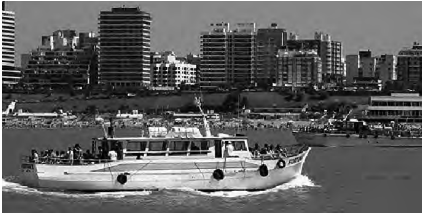
Impulsar el turismo náutico en destinos como Mar del Plata es una forma de crear nuevas alternativas para un sector sustentable

En España en 1998, ante la retracción que comenzaron a tener los históricos Centros de Verano de Sol, Playa y Agua , las Organizaciones Empresarias y el Gobierno Español tomando un modelo que los Franceses experimentaban sobre el Mediterráneo, comenzaron a innovar en el equipamiento de sus playas, aportando un subsidio renovado para llevar adelante un cambio, profundo. En la Madre Patria los Municipios, integrados en la Asociación Española de Estaciones Náuticas, (AEEN), fueron el motor de esa posibilidad. Que continúa haciendo su aporte. Se recordaba en muchas ciudades mediterráneas, que: la innovación es un deporte en equipo.