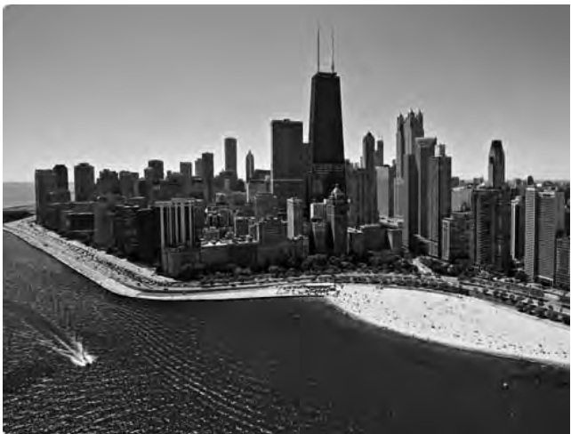
Vista aérea de la ciudad de Chicago, EE.UU.

Chicago, Estados Unidos - IPW International Pow Wow. Son tres días de citas pre-programadas de negocios, más de 1.000 organizaciones de viajes de todas las regiones de los Estados Unidos (en representación de todas las categorías de componentes de la industria), y más de 1.200 compradores internacionales y nacionales de más de 70 países. (Hasta el 9/4) Informes: www.ipw.com