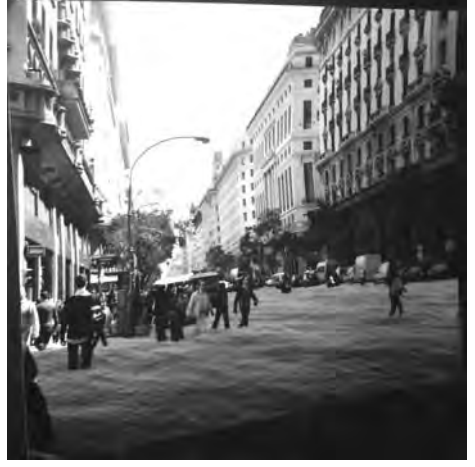
Inundación, obra de Ricardo Alazdraki

El fotógrafo Ricardo Alazdraki (DV n° 1400) continúa presentando sus trabajos en las vidrieras de Diario del Viajero , Avenida de Mayo 666, Buenos Aires. Las fotos son imágenes artísticamente, que se resignifican en una nueva mirada. Informes: ☎ (011) 4566-7523 eliasalazdraki@yahoo.com.ar