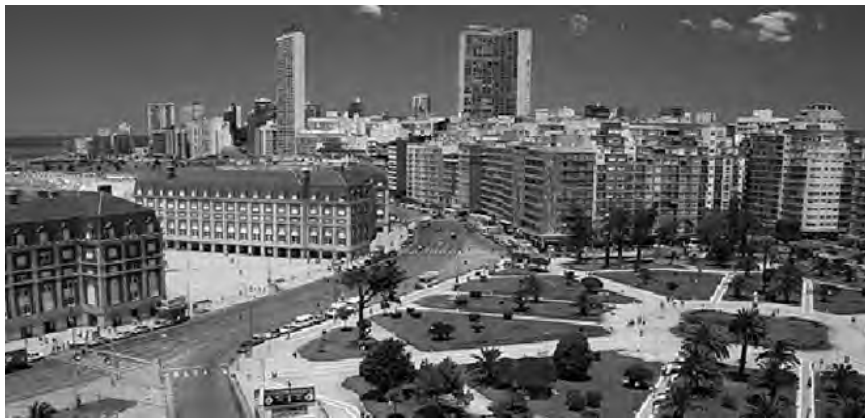
La ciudad de Mar del Plata presenta al visitante una bella y prolija estampa

Los dirigentes y sus equipos necesitan ser capaces de formular y articular de manera clara la visión, estrategia y objetivos innovadores y competitivos para trascender y tomar y mantener, el camino del éxito. Argentina, desde el Encuentro de Turismo Náutico , concretado en la ciudad de San Pedro, en el año 2011, por el Ministerio de Turismo de la Presidencia de la Nación, acompañado por la Secretaria de Turismo de la Provincia de Buenos Aires, empezamos a estudiar las variables que sobre el tema, eran posibles en sus 25.000 kilómetros de Bordes Navegables . Al ser nuestro país la 5ª oferta de la especialidad en el Planeta, desde la Subsecretaria de Desarrollo ha dado