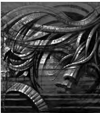
Schubert - fragmento Óleo sobre tela de Juan Kancepolski

Quienes visiten la muestra podrán disfrutar de la música de la Orquesta Sinfónica Nacional que brindará conciertos los viernes 14, 21 y 28 de marzo. Podrán escucharse obras de Debussy, Mozart, Schubert, Beethoven y Bach, ya que la música está presente en la creación de este artista, que escucha y plasma al momento de pintar. Abierto al público de lunes a viernes de 11 a 19 con acceso gratuito.