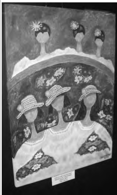
Fiesta de las flores, Medellín, Colombia, de Pablo Casartelli