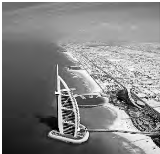
La ciudad de Dubai, en los Emiratos Árabes

Dubai, Emiratos Árabes - ATM Arabian Travel Market. Evento de viajes y turismo interancional para profesionales de viajes de ocio y del entretenimiento de todo el mundo (Hasta el 8/5) Informes: arabiantravelmarket.com