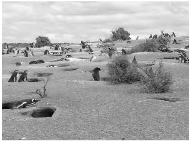
Las reservas naturales, como Punta Tombo, en Chubut, conjugan el turismo y el cuidado por el medio ambiente

El desarrollo del conocimiento humano y su aplicación, y la tecnología puesta a crear bienes y servicios