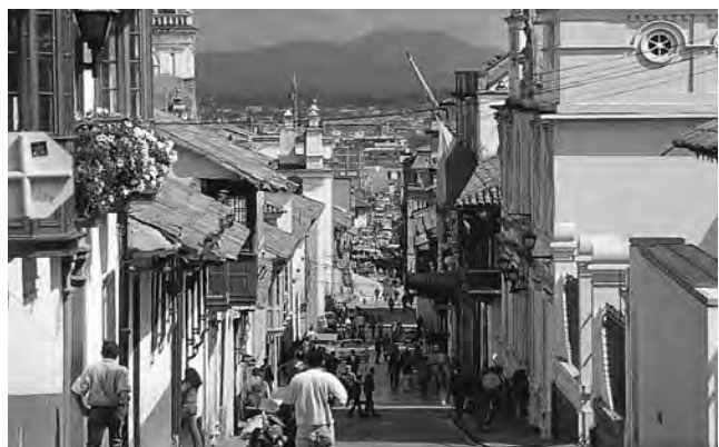
El barrio La Candelaria en el casco histórico de la ciudad de Bogotá, Colombia

Bogotá, Colombia - XLI Congreso Latinoamericano Skal Clackskal. Con el lema Hacer negocios entre amigos , este evento reúne cada año a profesionales de la industria del turismo de América Latina: aerolíneas, agentes de viajes, hoteles, restaurantes, tarjetas de asistencias y rentadores de autos. (Hasta el 4/5) Informes: bogotacb.com/skalbotoga2013/es