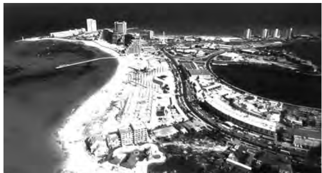
Cancún, en el estado de Quintana Roo, al sureste de la Ciudad de México. Ofrece a los turistas clima tropical húmedo de moderada brisa marina, con temperaturas que oscilan entre 26° y 36° C.

Quintana Roo, México - Tianguis Turístico. Este encuentro es para la promoción y comercialización de productos y servicios turísticos de México y para incrementar los flujos de visitantes provenientes de los mercados nacionales e internacionales. Se exhibirán los principales productos turísticos mexicanos: sol y playa, cultura, lujo, negocios y aventuras. (Hasta el 8/5) Informes: www.tianguis.turistico.2014.mtacancun.com