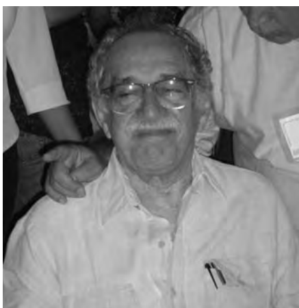
Gabriel García Márquez en una reunión de la Sociedad Interamericana de Prensa realizada en Cartagena de Indias en el año 2007

Gabo vivió una vida plena e incomparable. Lo recordaremos como un creador genial, un ser humano lleno de sabiduría, humor y ternura, un trabajador incansable, que supo mostrarnos que la