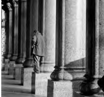
Ciudades de América de Facundo de Zuviría

En las salas de la Colección de Arte Amalia Lacroze de Fortabat -Olga Cossetini 141, Puerto Madero, Buenos Aires-, continuarán en exhibición hasta el domingo 29 de junio, las muestras temporarias Alicia en el País de las Maravillas , de Pat Andrea; Ciudades de América de Facundo de Zuviría y Universos de Moda , panorama de la moda local de los últimos 15 años. Se trata de tres exposiciones interdisciplinarias, en las que se podrán encontrar arte contemporáneo, fotografía y moda. Podrán realizarse visitas guiadas de martes a domingos a las 17. Horario: martes a domingos de 12 a 20. Entrada: $ 45.- ($20.- para menores de 12 años, jubilados, estudiantes y docentes; miércoles $20.- acceso gratuito para menores de 12 años, jubilados, estudiantes y docentes con acreditación). Informes: ☎ (011) 4310-6600 / info@coleccionfortabat.org.ar