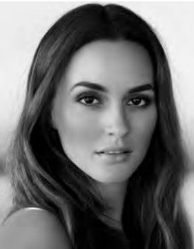
El bello rostro de Leighton Meester, imagen de Biotherm

Una nueva línea de tratamiento que mejora la textura de piel, signos de fatiga y finas líneas para mujeres de 30 y 40 años presenta la marca francesa Biotherm . Se trata de Skin Best , que trabaja sobre los primeros signos de la edad, es para aquellas jóvenes que llevan un estilo de vida muy intenso, con jornadas en las que se ocupan sin descanso de sus responsabilidades laborales, la familia y además tienen una vida social muy activa. Al final del día, la calidad de la piel no es la misma, los signos de fatiga, los poros y las líneas de expresión se hacen más visibles. La fórmula es una fusión de dos ingredientes provenientes del mundo marino: el extracto de espirulina, una de las mayores fuentes de energía y la astaxantina, un potente antioxidante.