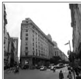
Los ángulos de Buenos Aires El cruce entre Diagonal Norte, Rivadavia y Reconquista

Buenos Aires, República Argentina - Miércoles 28 de mayo de 2014 - N° 1413 - Año XXIX