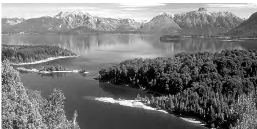
Así como el lago Nahuel Huapi tiene a su habitante imaginario Nahuelito, otros lagos de la Patagonia como el lago Tar, también cuentan historias de criaturas fantásticas