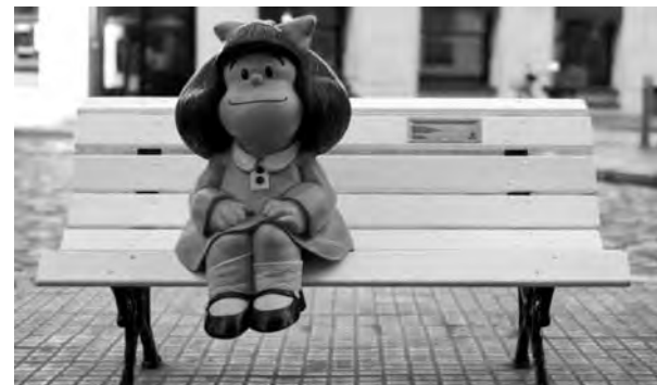
Mafalda de Quino, -en Defensa y Chile-, San Telmo

El Paseo la Historieta será inaugurado el sábado 31 de mayo, y podrá recorrerse gratuitamente desde las 14. Será una propuesta lúdica con las 15 esculturas que representan personajes históricos y 7 murales ubicados en los barrios porteños de San Telmo, Monserrat y Puerto Madero. La jornada finalizará a las 17 con un show de Kevin Johansen + The Nada + Liniers en el Museo del Humor, -Av. de los Italianos 851-. (ver página 7)