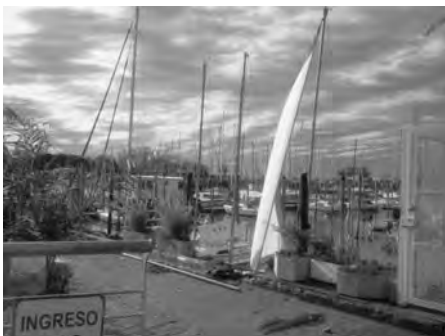
Entrada al Puerto de Olivos