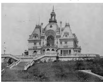
Mansión de Lucila Anchorena