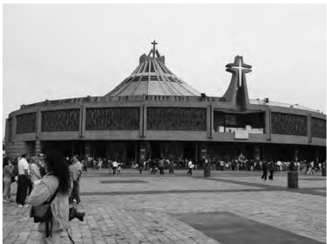
Basilica de Nuestra Señora de Guadalupe en la ciudad de México DF. Congrega cada 12 de diciembre a miles de fieles

México DF, México - FITA Feria Internacional de Turismo de las Américas. Reunirá a profesionales de la industria turística mundial con el fin de impulsar la promoción y comercialización de productos y destinos turísticos. (hasta el 21/09) Informes: info@fitamx.com www.fitamx.com