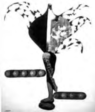
Obra de Alejandrina Devescovi