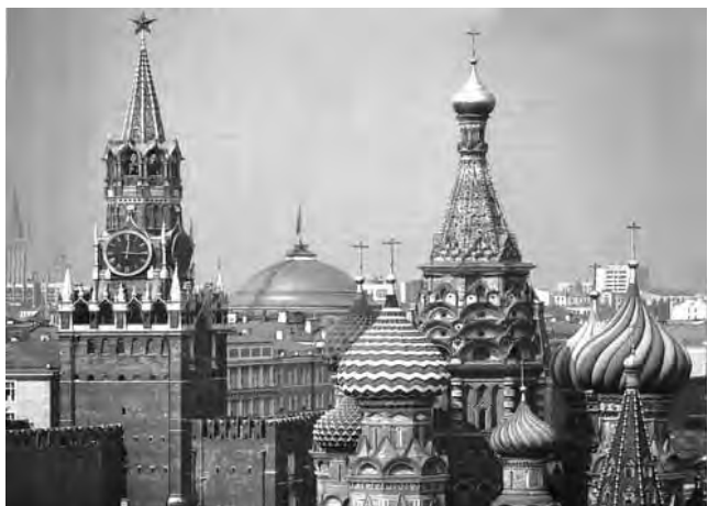
Las cúpulas moscovitas características de la capital rusa

Moscú, Rusia - Otdykh International Russian Travel Market . Feria internacional para los viajes de ocio en Rusia y otros países de la región. Se desarrollarán talleres y presentaciones de programas y conferencias de prensa. (hasta el 19/9) Informes: www.tourismexpo.ru