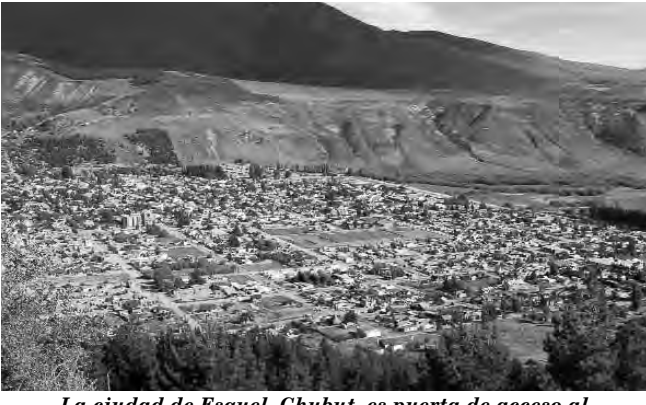
La ciudad de Esquel, Chubut, es puerta de acceso al Parque Nacional Los Alerces y a la Precordillera

Pigafetta, el cronista de la exploración de Magallanes, a la vieja imagen geográfica del extremo sur, incorpora un nuevo protagonista, que, por supuesto, debe cuajar dentro de la leyenda. Relata respecto de los habitantes más australes del planeta: ...Arrancando de allí, alcanzamos hasta los 50° del antártico. Volviendo hasta la privilegiada bahía de San Julián, donde, los barcos descubrieron un buen puerto para invernar. Permanecimos en él dos meses, sin ver a persona alguna. Un día, de pronto, descubrimos a un hombre de gigantesca estatura, quien, desnudo sobre la ribera del puerto,