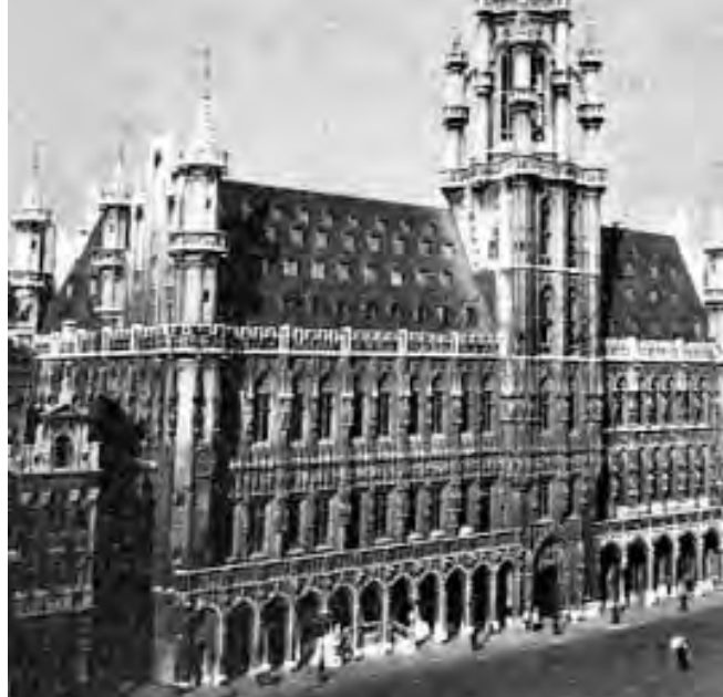
Edificio municipal de Bruselas, ciudad belga desde donde San Martín le escribió a su amigo Tomás Guido la carta aquí citada

La primera constatación fue que el Gran Capitán de los Andes no la refirió a sus compatriotas, sino a todos sus congéneres , de los que por supuesto no había porque excluir a sus conciudadanos. Y en segundo lugar, no la dijo sino que la escribió a su entrañable amigo, Tomás Guido, en una carta que le enviara desde Bruselas, el 18 de diciembre de 1827. Había sido a propósito de las razones de su retirada del Perú y del juicio que ella merecería de la opinión pública de ese momento y de la historia. Y el mismo Instituto Sanmartiniano, con su habitual eficiencia y cortesía, me proporcionó