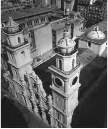
El templo de San Ignacio en la histórica Manzana de las Luces, Perú 272, Buenos Aires

La belleza de ese encuentro evangelizador es la que llega a nuestros sentidos a través de las grandes obras de arte (pintura, escultura, arquitectura y música) que todavía se perciben en las reducciones.