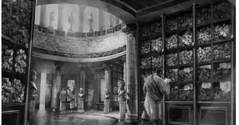
Internet aporta una imagen de la antigua Biblioteca de Alejandría

con piezas de porcelana. Sin olvidar el trabajo de los copistas, hacia el año 1400, sobre todo en los monasterios, debe recordarse el uso de la xilografía sobre tablillas de madera. Hacia 1450, Gutenberg inventó la imprenta y la Biblia fue su primer libro impreso. El avance tecnológico permitió la aparición de la imprenta electrónica y más tarde de la imprenta digital y con el soporte digital surgieron los libros electrónicos conocidos como e-books . Los soportes cambian pero, mientras existan escritores y lectores, la cultura tendrá garantizada su difusión. La convocatoria que año a año tiene la Feria del Libro en Buenos Aires es una palpable demostración de la necesidad de satisfacer a todos: a los que escriben y leen, desde lo antes posible al comienzo de sus vidas hasta su fin. La cultura etimológicamente proviene de cultivar. Los libros pueden entretener y divertir; aunque también, cual fertilizantes, logran nutrir los conocimientos humanos, tanto intelectuales como espirituales. Además, estimulan e incentivan la lectura de otros libros, provocando una continua y sabia búsqueda. Siembran, estimulan la curiosidad, el afán de superación y de esa forma enaltecen la formación integral de las personas. Porque la razón de ser del libro, más allá de su soporte, es brindar la oportunidad de transmitir conocimientos y de enriquecer la cultura en su acepción más amplia. Ese es el papel del libro.