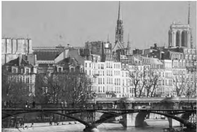
La Pasarela de las Artes, un atractivo cultural de París

París, Francia - IFTM Top Resa - International French Travel Market. Dedicado a los expositores que se centran específicamente en los viajes de negocios. Invita también a compradores provinciales para que desarrollen su producto. (hasta el 26/9) Informes: www.topresa.com