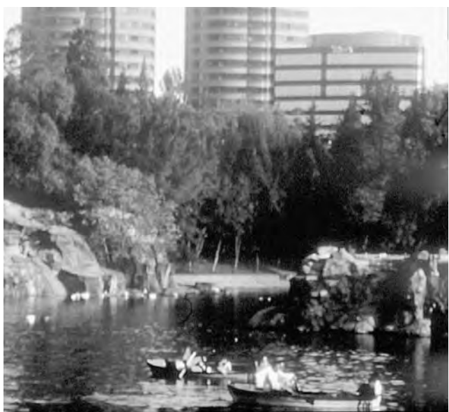
El parque de Chapultepec en la ciudad de México

México DF, México - FITA Feria Internacional de Turismo de las Américas. Reunirá a profesionales de la industria turística mundial con el fin de impulsar la promoción y comercialización de productos y destinos turísticos. (hasta el 21/09) Informes: info@fitamx.com www.fitamx.com