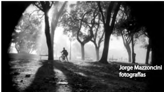
Jorge Mazzoncini fotografías

El viernes 15 de agosto, a las 19, tendrá lugar Encuentros abiertos - Festival de la Luz 2014 , en la Asociación Dante Alighieri, Tucumán 1646, Buenos Aires. Se presentará la exposición de fotografías Eterna Buenos Aires , de Jorge Mazzoncini y un recital de música italiana a cargo de Paolo Martini. La muestra podrá ser visitada hasta el 22 de septiembre, de lunes a viernes, de 16 a 19 y los sábados de 9 a 12. Organiza la Fundación Luz Austral. Entrada libre y gratuita. Informes: www.dante.edu.ar cultural@dante.edu.ar