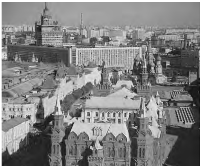
La Plaza Roja escoltada por las Torres del Kremlin y la Catedral de San Basilio, una postal de Moscú (en ruso, Moskva)

Moscú, Rusia - Otdykh International Russian Travel Market. Feria internacional para los viajes de ocio en Rusia y otros países de la región. Se desarrollarán talleres y presentaciones de programas y conferencias de prensa. (hasta el 19/9) Informes: www.tourismexpo.ru