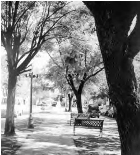
Plaza de la ciudad de Mercedes, ciudad bonaerense desde donde partían las expediciones que duraban unos cuatro meses en busca de la sal

El gobernador emitía un bando donde se indicaba: fecha de salida, lugar de reunión de las carretas, composición de la escolta, nombre del jefe militar a quien se confiaba la empresa. Los puntos de reunión eran Luján, la Guardia de Luján-hoy Mercedes- y la laguna de Palantelen. Los concurrentes quedaban sujetos al régimen militar, teniendo el jefe, amplia facultad para conservar el orden y la disciplina. Durante la noche se hacía un cerco de carretas rodeando