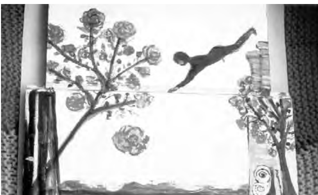
Una de las obras del artista plástico Julio Salinas