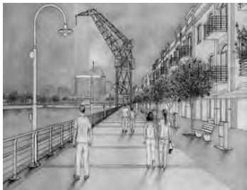
Tarde en Puerto Madero lápiz y témpera de Marta Marchetti