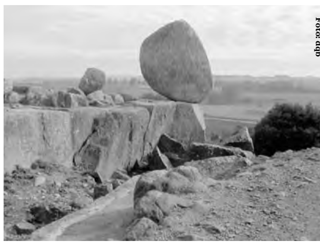
El Cerro El Centinela a 5 kilómetros del centro de Tandil junto a la famosa piedra movедiza otorgan una identidad propia a la región de Sierra de la Ventana

Erich Fromm plantea que: según él expone, la identidad es una necesidad afectiva -sentimiento-, cognitiva -conciencia de sí mismo y del vecino como personas diferentes- y activa -el ser humano tiene que tomar decisiones haciendo uso de su libertad y voluntad. Se puede afirmar, entonces, que la identidad tiene que ver con nuestra historia de vida, que será influida por el concepto de mundo que manejamos y por el concepto de mundo que predomina en la época y lugar en que vivimos. Por lo tanto, hay en