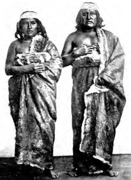
El célebre cacique Casimiro (Casimiro Biguá) y su hijo Sam Slick, 1864.

En 1840 muere su madre María la Grande Jujuna , reina de los tehuelches, la reemplaza Casimiro con 21 años de edad, teniendo un inmenso territorio que cuidar. Recurrió a todos los argumentos para mantener la integridad del territorio y a su pueblo unido, así trenzó con un irlandés el cuidado del Estrecho de Magallanes cobrando una tasa a las embarcaciones guaneras. Desde la costa se relacionaba con los tripulantes de los buques, el capitán de la fragata inglesa Viven , lo invitó a bordo como auténtico dueño de la tierra , la que recorrió en su condición de cacique.