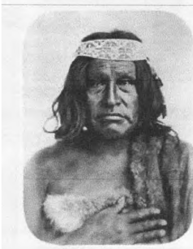
Casimiro Biguá, cacique principal del pueblo Tehuelche, fotografía tomada por Benito Panuzzi en 1864

Las ideas-fuerza , como estado, poderes públicos, instituciones, etc. , tienen validez y respeto según